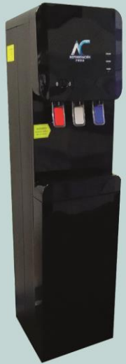
Dispensador con sistema de filtros HSM-87LB