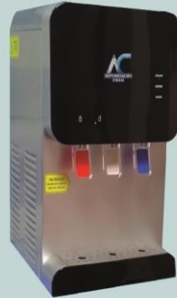
Dispensador con sistema de filtros YLR2-5-x (HC66L)